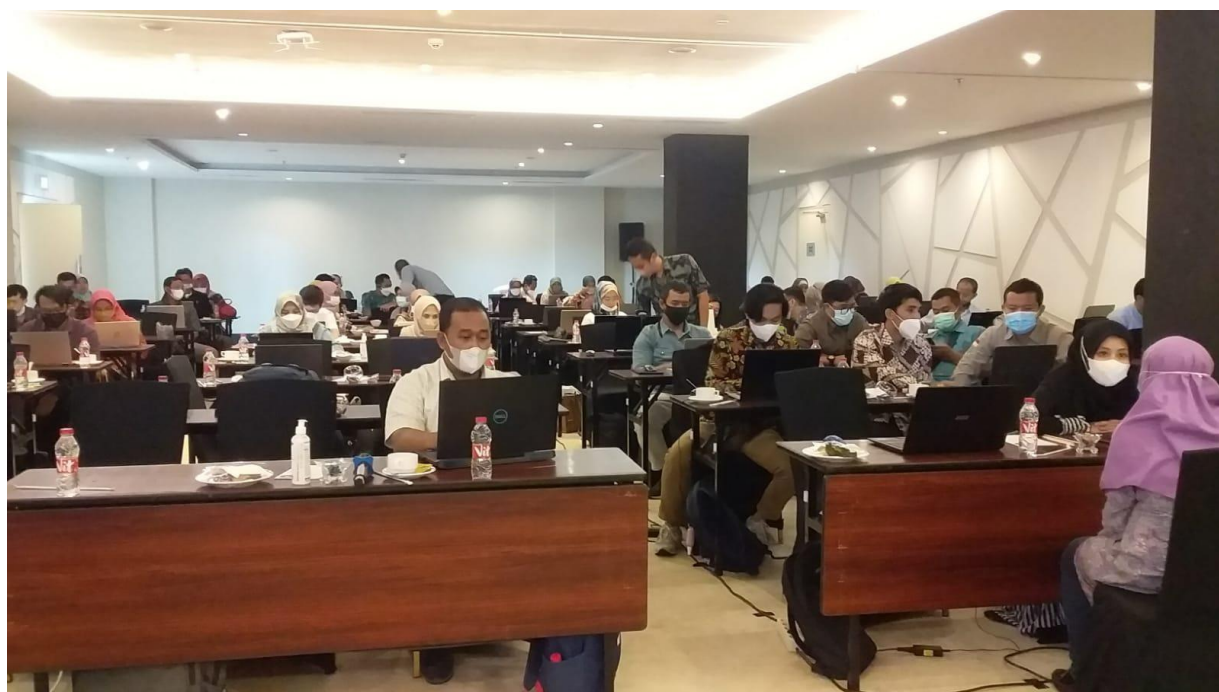
Gambar 2. Kegiatan Peningkatan Kualitas Jurnal

Faktor-faktor pendukung keberhasilan antara lain adalah penggiatan dosen dan mahasiswa dalam menciptakan luaran publikasi nasional terindeks Sinta 2 baik dalam penelitian maupun PPM, peningkatan publikasi jurnal sinta 2 didukung oleh sosialisasi yang terus dilakukan oleh tim jurnal baik secara daring dan luring kepada user untuk mendapatkan jurnal yang berkualitas, pendampingan yang dilakukan oleh PPBI LPPM UNY untuk meningkatkan kualitas pelayanan untuk bisa terbit tepat waktu, dan pendampingan untuk mempersiapkan perankingan jurnal sinta menuju sinta 1 secara intensif. Beberapa kendalanya adalah, untuk mendapatkan artikel berkualitas yang ditulis oleh pengusul dan mitra dari luar negeri dan mencari/menentukan reviewer yang bisa bekerja secara cepat dalam melakuakn proses reviewer.