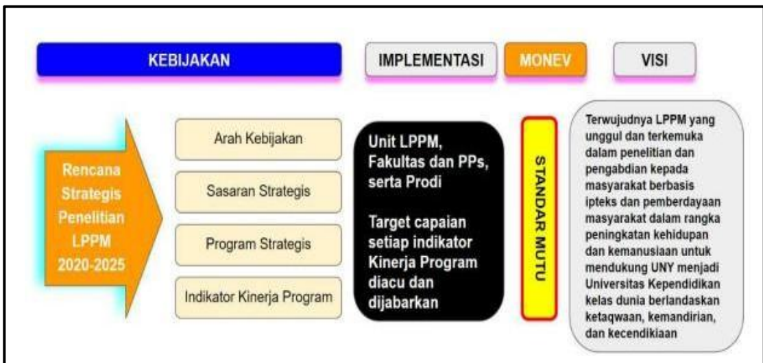
Gambar 3. Strategi Pencapaian Indikator Kinerja Program Rencana Strategi Penelitian DRPM UNY Tahun 2021-2025

Rencana strategi penelitian DRPM UNY ini dijabarkan dalam arah kebijakan, sasaran strategi, program strategi dan indikator kinerja program. Implementasi pencapaian setiap indikator kinerja program pada rencana strategis penelitian DRPM UNY diacu setiap unit dan dijabarkan secara proporsional pada fakultas, PPs dan prodi-prodinya. Pembagian proporsional berdasarkan jumlah penelitian di masing-masing fakultas dan PPs.