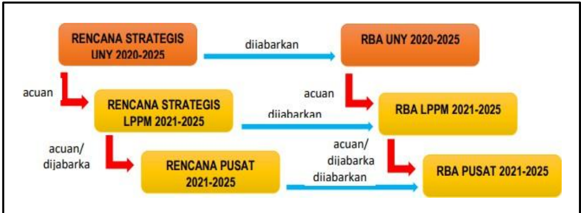
Gambar 2. Strategi Penjabaran Rencana Strategi DRPM UNY

Rencana strategi penelitian DRPM UNY ini dijabarkan dalam arah kebijakan, sasaran strategi, program strategi dan indikator kinerja program. Implementasi pencapaian setiap indikator kinerja program pada rencana strategis penelitian DRPM UNY diacu setiap unit dan dijabarkan secara proporsional pada fakultas, PPs dan prodi-prodinya. Pembagian proporsional berdasarkan jumlah penelitian di masing-masing fakultas dan PPs.