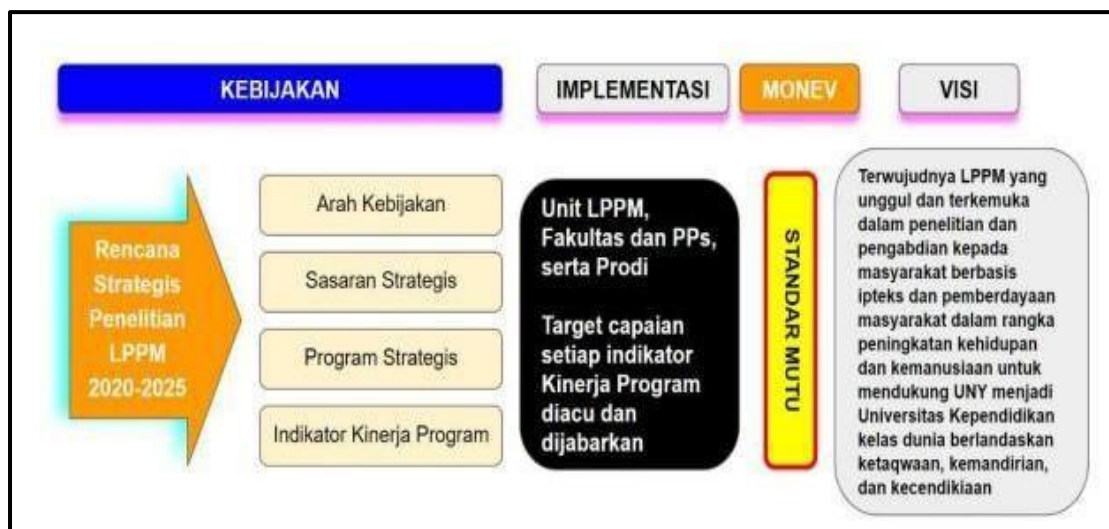
Gambar 3. Strategi Pencapaian Indikator Kinerja Program Rencana Strategi Penelitian DRPM UNY Tahun 2021-2025