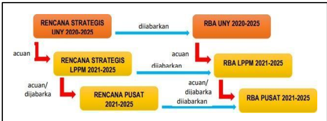
Gambar 2. Strategi Penjabaran Rencana Strategi DRPM UNY

Rencana strategi DRPM UNY menjadi pedoman dalam mewujudkan target yang telah ditetapkan dan dijabarkan menjadi Rencana Operasional (Renop) di lingkungan DRPM dan tentunya menjadi acuan bagi Fakultas untuk dijabarkan. Renop DRPM UNY dijabarkan per tahun dalam dokumen yang memuat rencana kegiatan dan penganggaran terpadu (RKPT) disebut Rencana Bisnis Anggaran (RBA). Adapun gambaran rencana strategi DRPM UNY adalah sebagai gambar berikut ini: