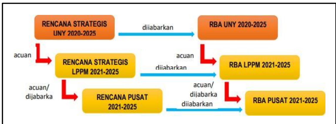
Gambar 2. Strategi Penjabaran Rencana Strategi DRPM UNY

Rencana strategi DRPM UNY menjadi pedoman dalam mewujudkan target yang telah ditetapkan dan dijabarkan menjadi Rencana Operasional (Renop) di lingkungan DRPM dan tentunya menjadi acuan bagi Fakultas untuk dijabarkan. Renop DRPM UNY dijabarkan per tahun dalam dokumen yang memuat rencana kegiatan dan penganggaran terpadu (RKPT) disebut Rencana Bisnis Anggaran (RBA). Adapun gambaran rencana strategi DRPM UNY adalah sebagai gambar berikut ini: