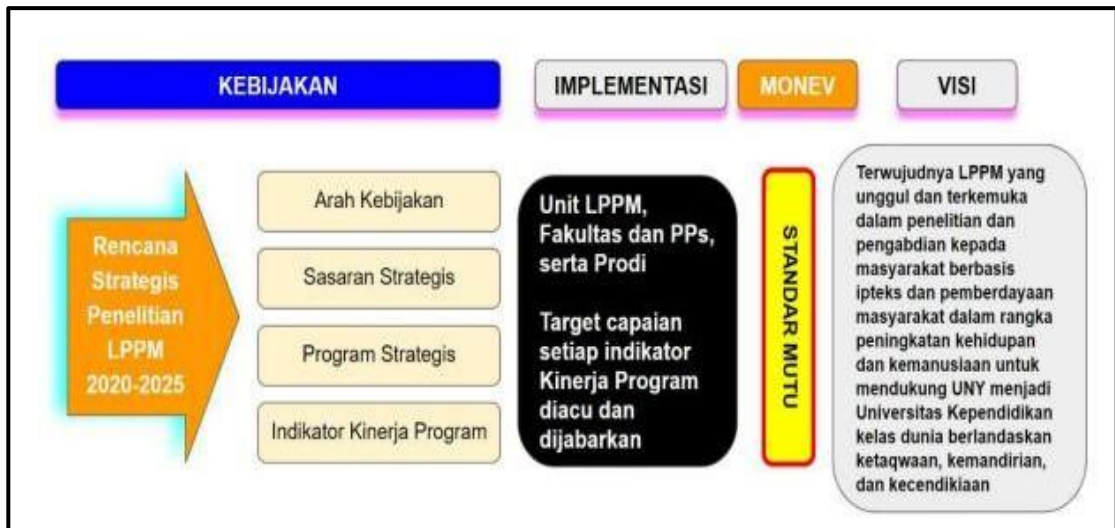
Gambar 3. Strategi Pencapaian Indikator Kinerja Program Rencana Strategi Penelitian DRPM UNY Tahun 2021-2025