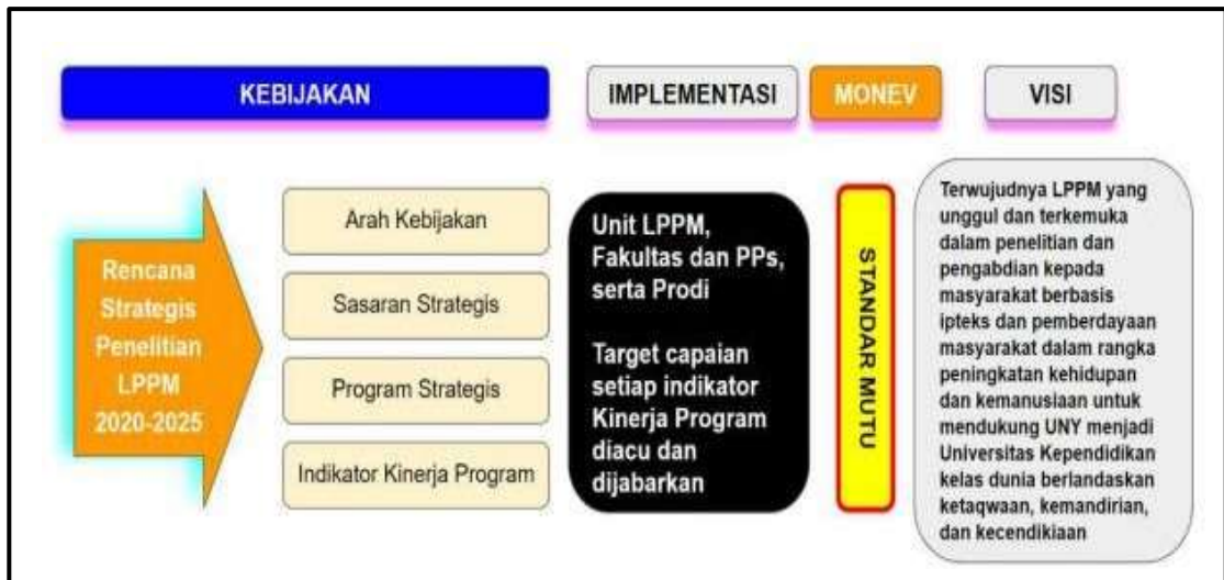
Gambar 3. Strategi Pencapaian Indikator Kinerja Program Rencana Strategi Penelitian DRPM UNY Tahun 2021-2025