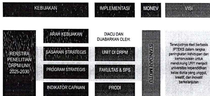
Gambar 2. Strategi Pencapaian Indikator Kinerja Program Rencana Strategis Penelitian DRPM UNY 2025-2030

Pimpinan di tingkat universitas, DRPM, fakultas/sekolah pascasarjana, dan program studi menjadi motor penggerak dalam mengimplementasi Renstra, dengan memberdayakan segenap peneliti. Dalam rangka mencapai efektivitas dan efisiensi manajemen, di samping melaksanakan pengendalian umum, Pimpinan DRPM dan unit-unitnya bersama Wakil Dekan bidang Riset, Kerjasama, Sistem Informasi, dan Usaha dan Wakil Direktur bidang Akademik, Kemahasiswaan, Riset, dan Kerjasama Sekolah Pascasarjana melaksanakan pembidangan ranah kerja sebagai berikut.